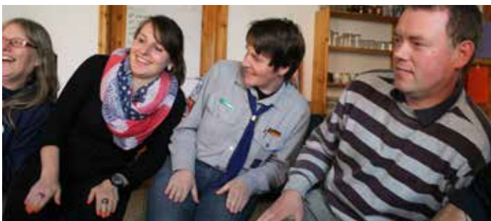
Grundkurs für Quereinsteigende