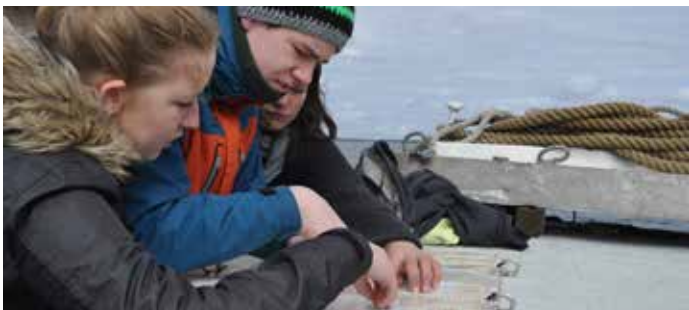
Auf Fahrt-Kurs: für Jugendliche von 13 bis 15 Jahren

Die angegebenen Teilnahmebeiträge gelten für VCP-Mitglieder. Nicht-Mitglieder zahlen in der Regel einen um 50 Prozent erhöhten Beitrag. Es gelten die Teilnahmebedingungen des VCP Land Niedersachsen: vcp-niedersachsen.de/Termine