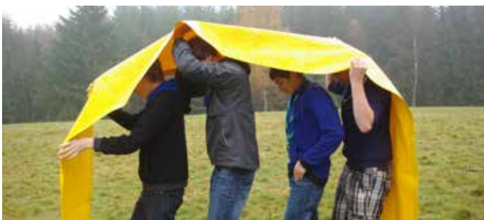
Grundkurs für (angehende) Jugendgruppenleitungen